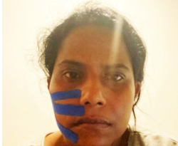
Ashin kasvat teipattiin roikkunan estämiseksi.

kuten sädehoito, epäonnistuivat, hänelle varattiin leikkauksia kasvavan kasvaimen poistamiseksi.