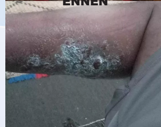
MUUTAMAN PÄIVÄN PÄÄSTÄ