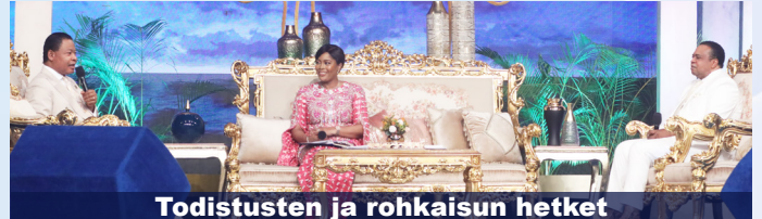
Todistusten ja rohkaisun hetket