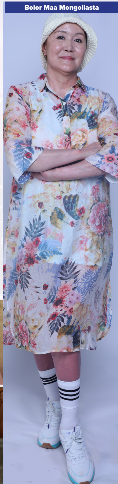
Bolor Maa Mongoliasta

Ole hyvä ja lähetä todistuksesi osoitteeseen testimonies@healingstreams.tv