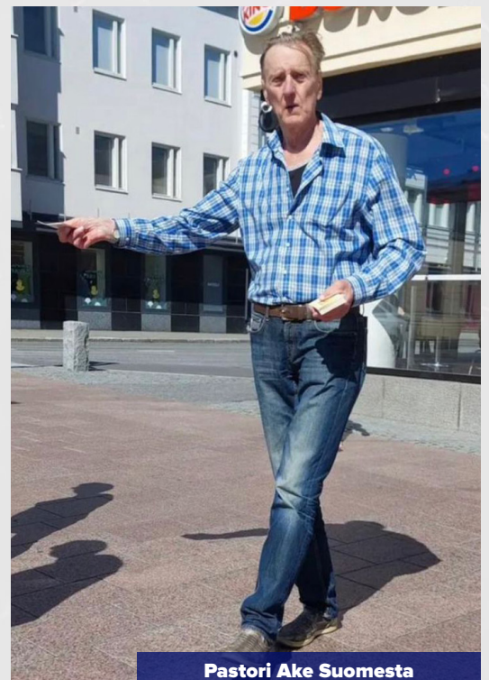
Pastori Ake Suomesta