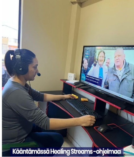
Kääntämässä Healing Streams -ohjelmaa