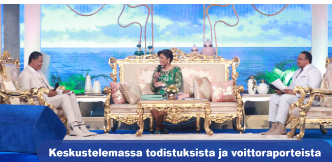
Keskustelemassa todistuksista ja voittoraporteista