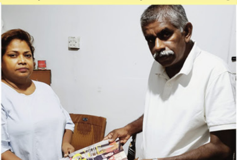
Oneli jakamassa lehtiä ja kertomassa parantumisesta